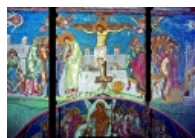
DW edicion special për vjedhje në kishat shqiptare