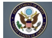
DASH: Në Luginë, të rinjtë shqiptar arrestohen për motive politike