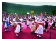
Përgatitjet përfundimtare për festivalin "Hasi Jehon"