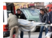
Hidhet nga kati i katërt, vdes 39-vjeçari