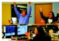
Çmimet "Pulitzer" për gazetari dhe art