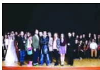
Gjakova prodhon të parin mjuzikël shqiptar