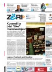
Ballina e Gazetes ne PDF