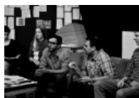
Guximi dhe përgjegjësia e autorëve në "Polip"