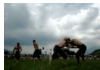
Lojërat popullore, thesare vlerash kombëtare